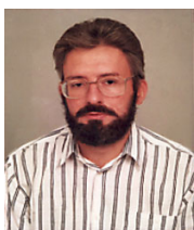
Aleksandar Simić, Sudija Saveznog ustavnog suda