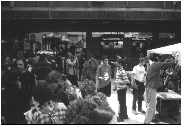
ANKETA: Čak osamdeset odsto ispitanika smatralo je da mladići koji budu bili u civilnoj službi neće ništa izgubiti propuštanjem vojne obuke

pravilu) u prebivalištu prigovarača savesti (po mogućstvu na teritoriji opštine prebivališta), koji ima radno vreme od osam sati dnevno, a ostatak dana je slobodno vreme. Vikend bi trebalo da bude slobodan, ali to zavisi od rasporeda radnog vremena organizacije u kojoj se služi.