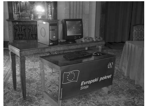
SVEČANO: Računari su zvanično uručeni na prigodnoj svečanosti u svečanoj sali Skupštine Grada Beograda

Pored predstavnika lokalnih vlasti i gradske uprave, predstavnika EpuS-a i domaće softverske firme INKO, koja je dizajnirala budžetski softver i sajt javnih nabavki, prisustvovali su i predstavnici medija.