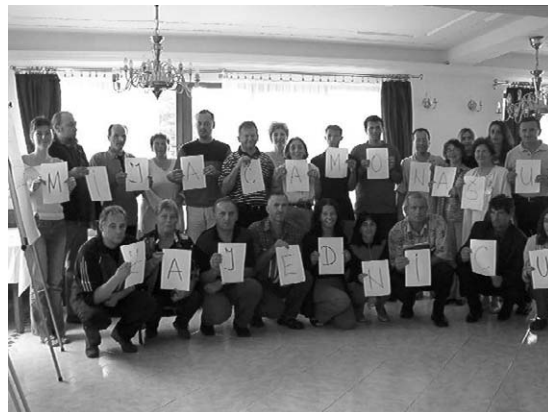
OSNAŽIVANJE: Održano je ukupno deset seminara „Osnaživanje lokalne zajednice“

U junu 2003. osnovan je, naime, Fond za podršku civilnom društvu u Srbiji, čiji su osnivači Evropski pokret u Srbiji i Ekspertska mreža. Uz podršku CARDS programa Evropske unije, novoosnovani Fond 1. oktobra 2003. raspisuje konkurs za dodelu sredstava nevladinim organizacijama u opštinama istočne i zapadne Srbije.